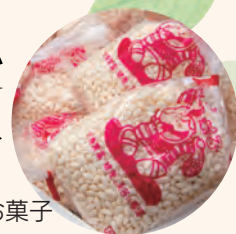
昔なつかしいお米のお菓子