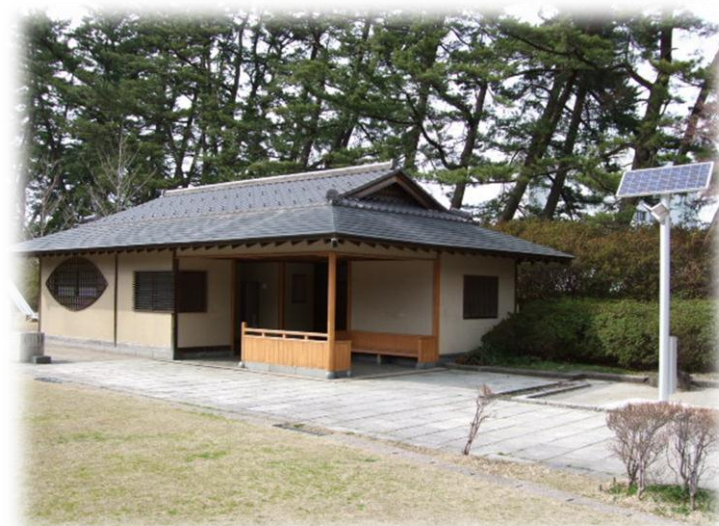
↑【上写真】省エネと自家発電を一体的に改修した 本荘公園内の公衆トイレ及びLED 外灯